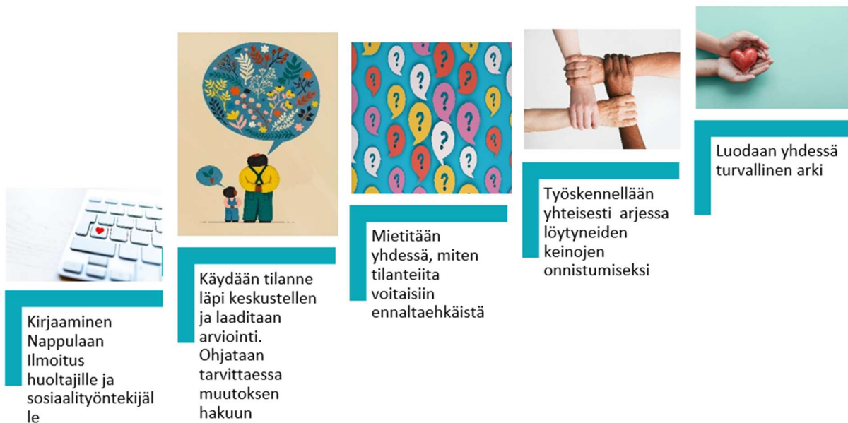
Kuva 2. Rajoitustoimenpiteen jälkeen

Aikuiset ohjaavat sinua tässä prosessissa ja saat heiltä aluehallintoviraston, sosiaaliasiamiehen ja laillisuusvalvojen yhteystiedot. Jokaisella Topaasin aikuisella on velvollisuus kertoa sinulle oikeuksistasi ja tuettava sinua oikeudessaan tehdä ilmoitus saamastaan kohtelusta tai hakea muutosta häntä koskeviin päätöksiin. Jokaisen rajoitustoimenpiteen kohdalla sinulle selvitetään oikeutesi muutoksen hakuun, mikäli sellainen on rajoitustoimenpiteen osalta mahdollinen. Sinulla on aina oikeus tehdä kantelu, eikä kukaan saa vähätellä tai estää sitä. Sinua tulee kuulla ja toivottavasti pystyt kääntymään tilanteen tullen esimerkiksi omaohjaajien, sosiaalityöntekijän, valvontaviranomaisen tai muiden sinulle tärkeiden ammattilaisten puoleen.