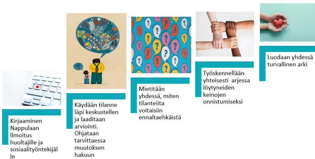
Kuva 2. Rajoitustoimenpiteen jälkeen

Aikuiset ohjaavat sinua tässä prosessissa ja saat heiltä aluehallintoviraston, sosiaaliamiehen ja muut tärkeät yhteystiedot. Jokaisella aikuisella on velvollisuus kertoa sinulle oikeuksistasi ja tuettava sinun oikeudessaan tehdä ilmoitus saamastaan kohtelusta tai hakea muutosta häntä koskeviin päätöksiin.